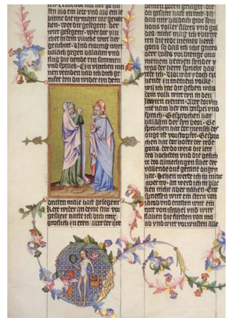
Baderin Medaillon aus der Wenzels-Bibel, 1390/1400 Österreichische Nationalbibliothek, Wien