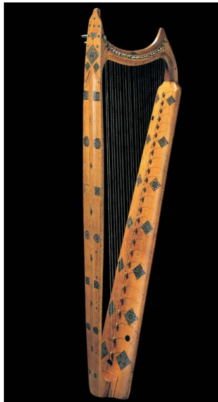
Harfe 2. Drittel 15. Jhd., Tirol Ahornholz, Eisen, Darmsaiten, B 33,5 cm, L 91,6 cm 1983/84 restauriert Tirol, wahrscheinlich aus dem Nachlass des Oswald von Wolkenstein Wartburg-Stiftung Eisenach