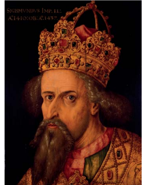
Albrecht Dürer Bildnis des Kaisers Sigismund Nürnberg, 1514 Öl/Lindenholz: 64 x 46,8 cm Rahmen: 79 x 62,8 x 5,5 cm (mit Glas, mit Rahmen) Inv. Nr.: Gm 2003/9 Stiftung Deutsches Historisches Museum, Berlin