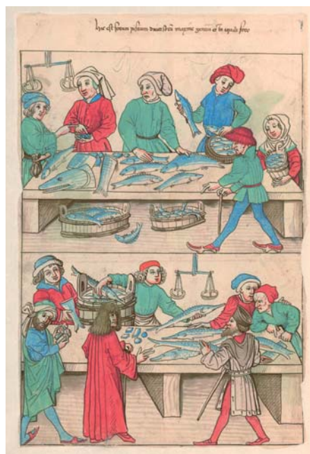
Fischmarktstreiben: Oswald von Wolkenstein als Fischkäufer (Szene unten links) Ulrich Richental: Das Konzil zu Konstanz (Konzilschronik), Cod. VII A 18, fol. 28v, Nationalbibliothek Prag