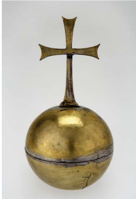
Reichsapfel mit Kreuz Buda oder Visegrád, vor 1437 Ungarisches Nationalmuseum, Budapest