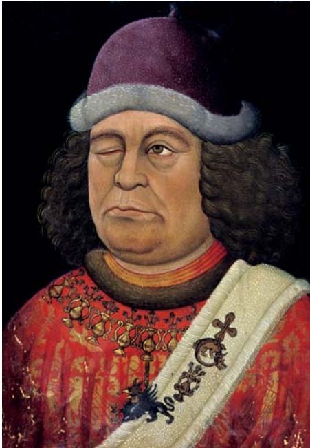
Porträt Oswald von Wolkenstein Rodenegg-Innsbrucker Liederhandschrift (1432; Nachträge bis nach 1438) Landes- und Universitätsbibliothek, Innsbruck