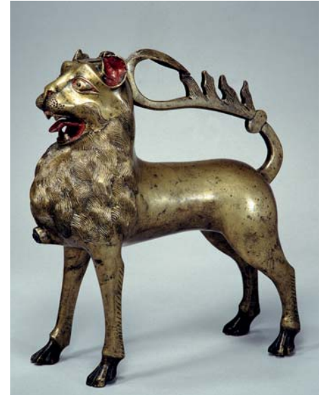
Aquamanile in Gestalt eines Löwen Nürnberg, um 1400 Bayerisches Nationalmuseum, München