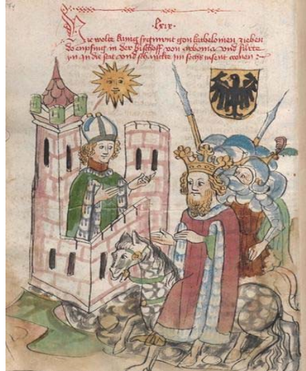
König Sigismund 1415 vor Narbonne

Interdisziplinäres Symposium organisiert in Verbindung mit dem Lehrstuhl für Germanistische Mediävistik der Ruhr-Universität Bochum